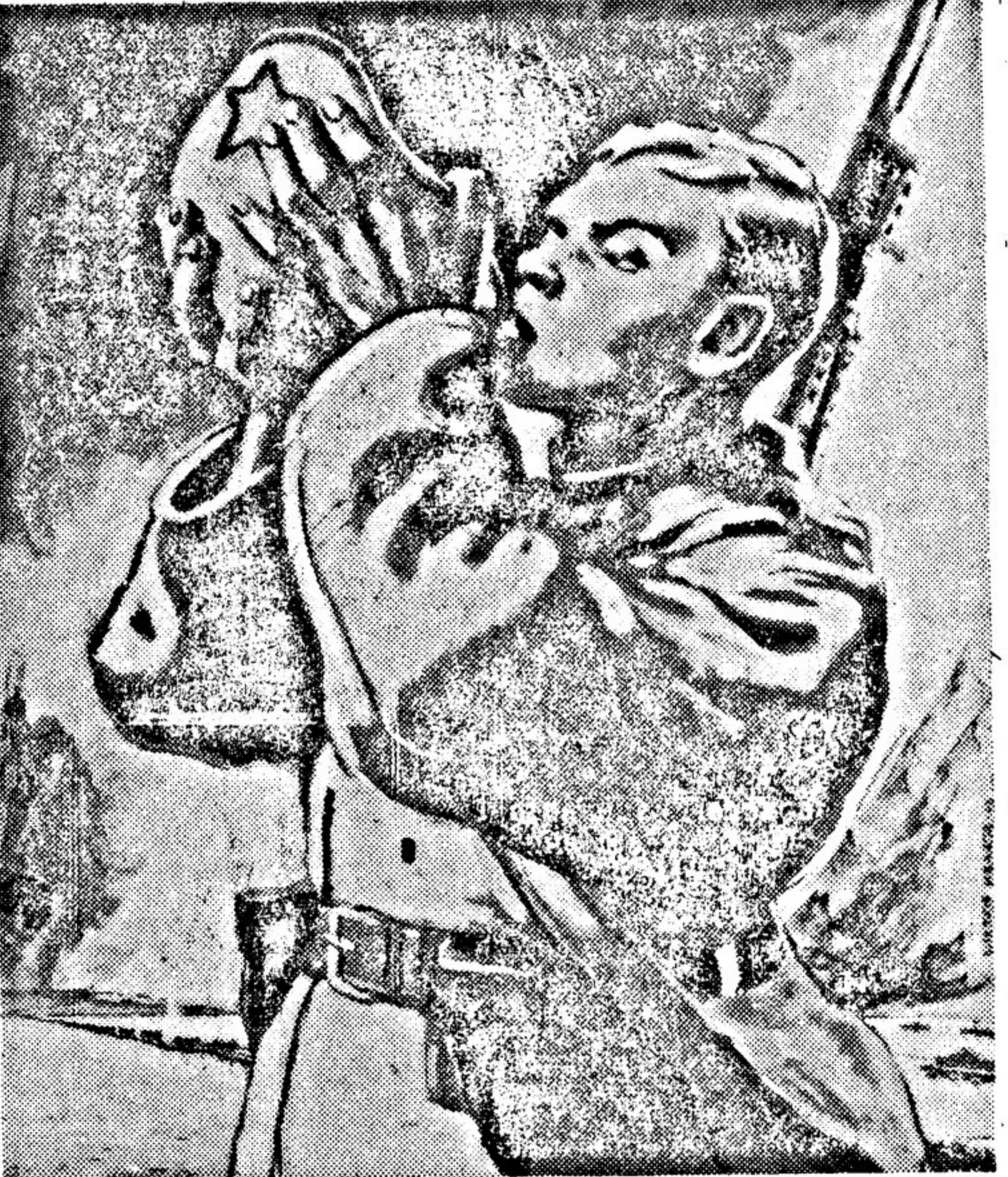
«Пьем воду из Днепра, — будем пить из Прута, Немана и Буга» Плакат В. ИВАНОВА, получивший первую премию на конкурсе издательства «Искусство».

В Казахском отделении ОГИЗ (г. Алма-Ата) вышел из печати сборник фронтовых рассказов гвардейцев 73-й Сталинградской гвардейской стрелковой дивизии. Сборник «Мы воюем» создан в результате творческого сотрудничества гвардии майора Карамышева, гвардии младшего лейтенанта Ткаченко, гвардии сержанта Аслугужиева,