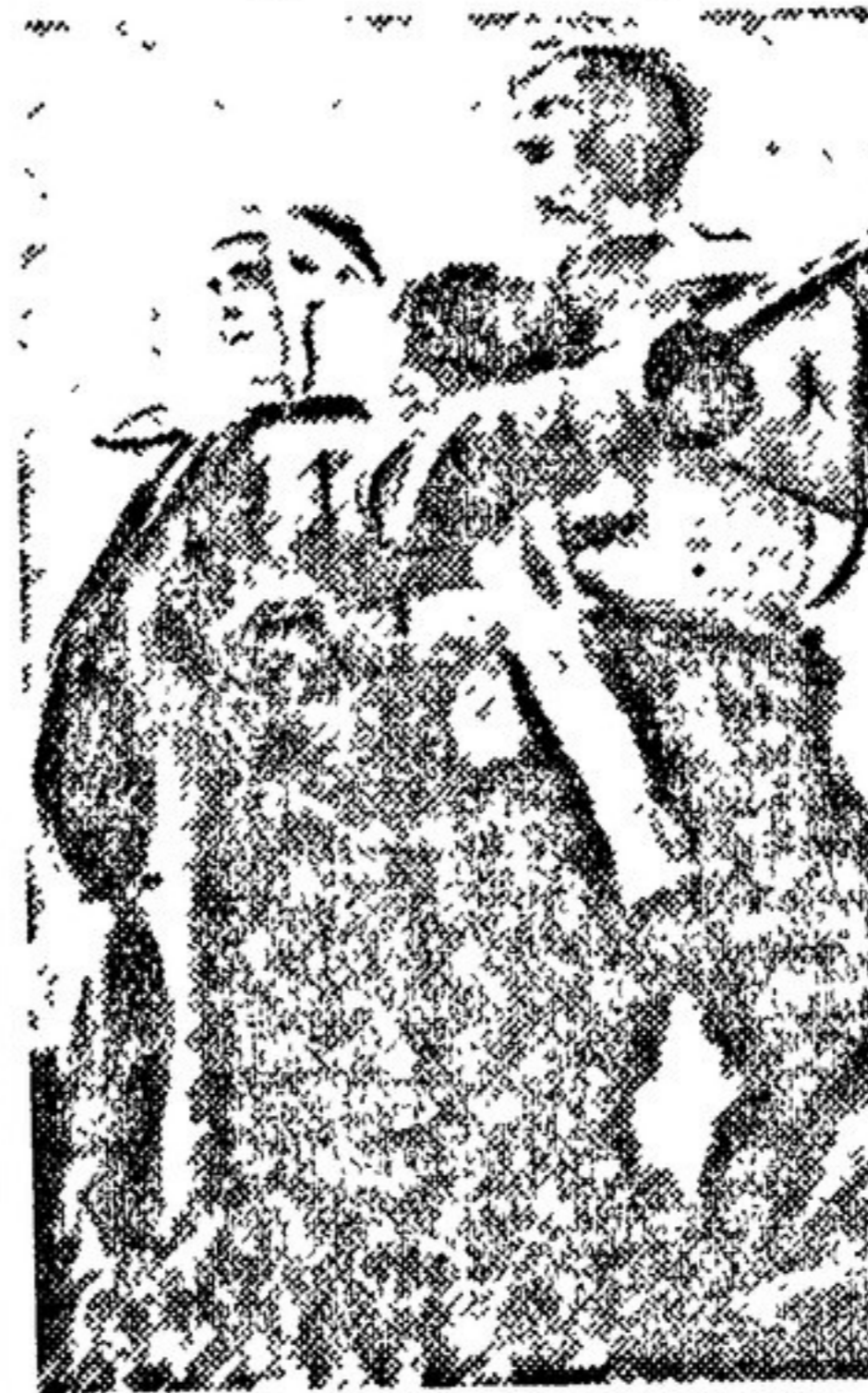
Раненые бойцы. Кадр из фильма «Битва за нашу Советскую Украину».

«Битва за нашу Советскую Украину» — достойный памятник нашего героического времени.