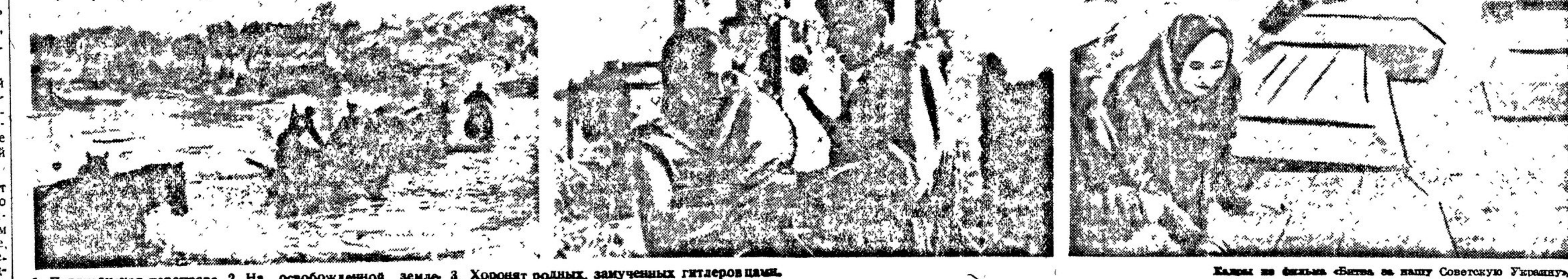
1. Партизанская переправа. 2. На освобожденной земле. 3. Хоронят родных, замученных гитлеровцами.

Силою взятые операторами эпизоды, мастерски снятый документальный материал, великолепный дикторский текст А. Довженко, который как подхватывает и формулирует ваши чувства и мысли, возникающие в процессе восприятия фильма, — все это делает картину выдающимся явлением советской культуры.